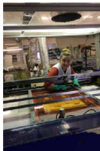
Sérigraphie en action