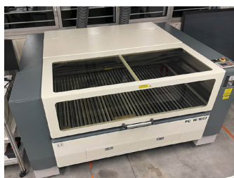
Machine de découpe laser Mise en service en janvier 2022

Activ'Claviers améliore encore la puissance industrielle et la flexibilité de son parc de découpe via l'acquisition de deux nouvelles machines dont les performances contribuent à l'amélioration continue de la qualité et des délais. Deux atouts de plus pour notre maîtrise technique et la garantie d'une qualité de service optimale !