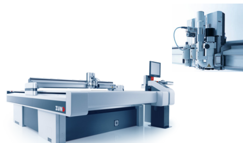
Table de découpe ZÜND Mise en service en juin 2022